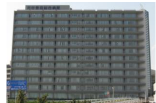
刈谷豊田総合病院