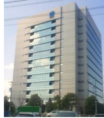
日本ガイシ(株)本社ビル