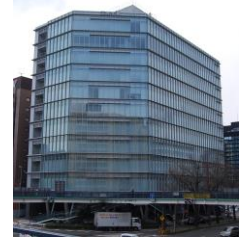
三井生命名古屋ビル