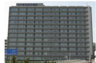
刈谷豊田総合病院