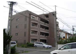
グランパーク高畑 (名古屋)