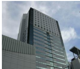
サウスポット静岡