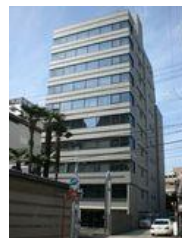
伊藤忠丸の内ビル (名古屋)