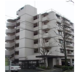
KSマンション南福岡 (福岡)