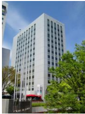
浜松第一生命日通ビル