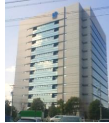
日本ガイシ(株)本社ビル