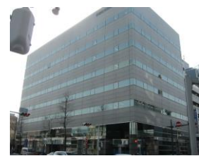
県信松本深志ビル