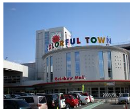
カラフルタウン岐阜