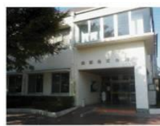
地区会館(山田他 3 件)