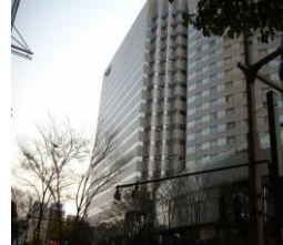
ヴィサージュビル