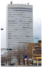
名古屋国際センタービル