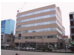
今池ゼネラルビル (名古屋)