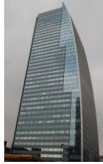
名古屋ルーセントタワー