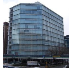
三井生命名古屋ビル