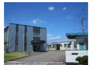
パイロット東郷工場