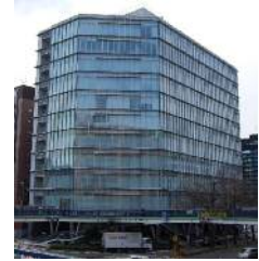
大樹生命名古屋ビル