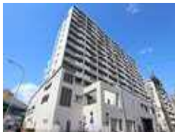
ヴェルクレート日比野 B 棟