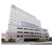
ホテルグリーンパーク津(三重)