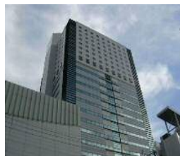
サウスポット静岡