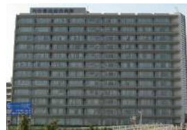
刈谷豊田総合病院