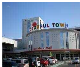
カラフルタウン岐阜