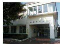
地区会館(山田他 4 件)、 生涯学習センター(3 件)