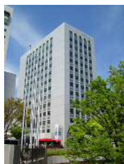
浜松第一生命日通ビル