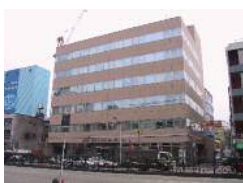
今池ゼネラルビル (名古屋)