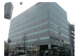
県信松本深志ビル