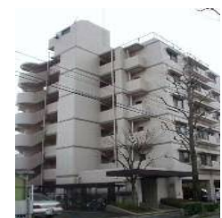
KSマンション南福岡 (福岡)