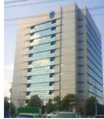
日本ガイシ(株)本社ビル