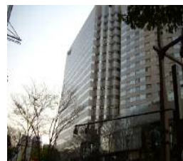
ヴィサージュビル