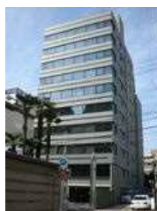
伊藤忠丸の内ビル (名古屋)