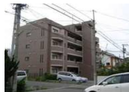
グランパーク高畑 (名古屋)