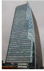
名古屋ルーセントタワー