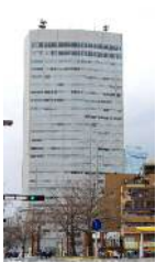
名古屋国際センタービル