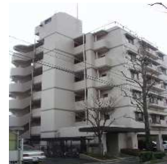
KSマンション南福岡 (福岡)