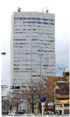
名古屋国際センタービル