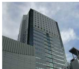
サウスポット静岡