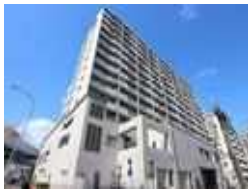
ヴェルクレート日比野 B 棟