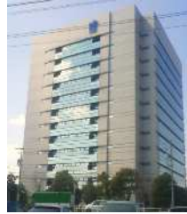
日本ガイシ(株)本社ビル