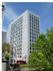
浜松第一生命日通ビル