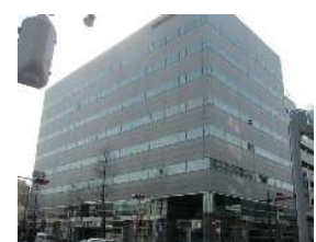
県信松本深志ビル