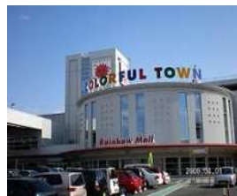
カラフルタウン岐阜