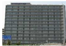
刈谷豊田総合病院