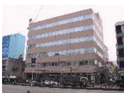
今池ゼネラルビル (名古屋)