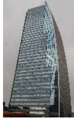
名古屋ルーセントタワー