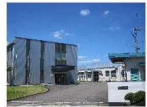
パイロット東郷工場