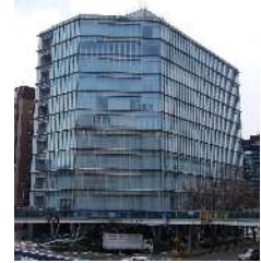
大樹生命名古屋ビル