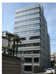
伊藤忠丸の内ビル (名古屋)