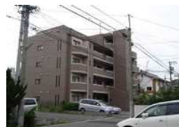
グランパーク高畑 (名古屋)