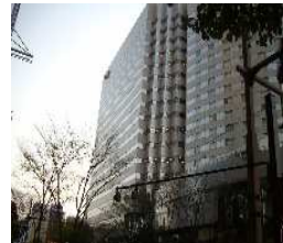
ヴィサージュビル