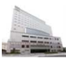
ホテルグリーンパーク津(三重)