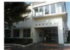
地区会館(山田他 4 件)、 生涯学習センター(3 件)